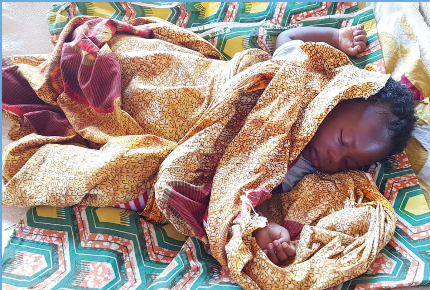
Miminko, tržičtě v Libérii

LIKVIDACE LEPRY – Společenství pomocníků misijních leprosárií