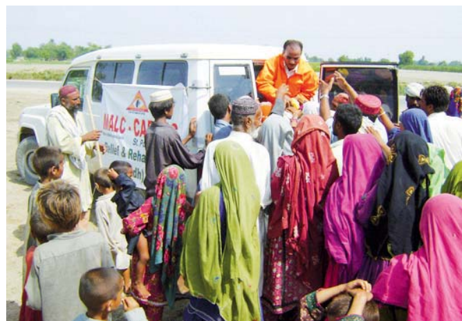
MALC, přerozdělování léků

Díky Vaší pomoci jsme mohli za poslední dobu poslat do této oblasti léky za více než jeden milion korun.