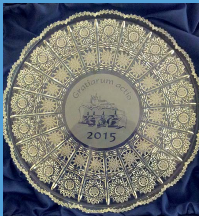
Cena Gratiarum actio

Zastává funkci ředitele DAHW od 1. května 2009.