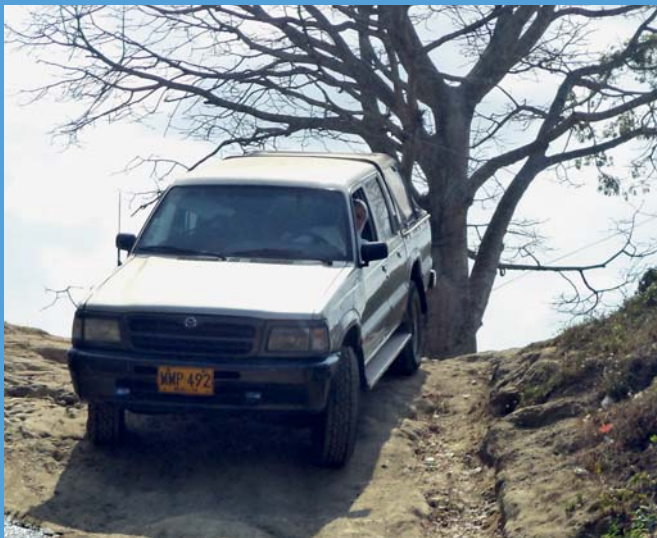
Matka Gladis řídí auto na cestě za malomocnými, Cienaga de Oro, Kolumbie.