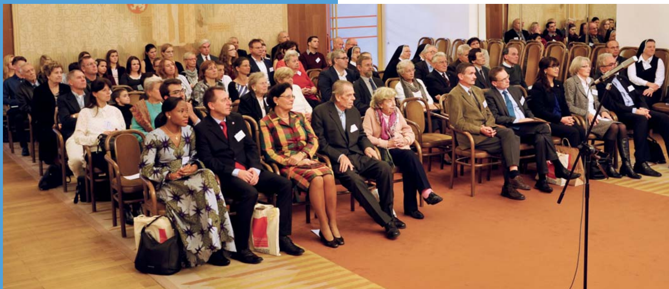
Přátelé a dobrodinci Likvidace lepry na slavnostním shromáždění Gratiarum actio 2015