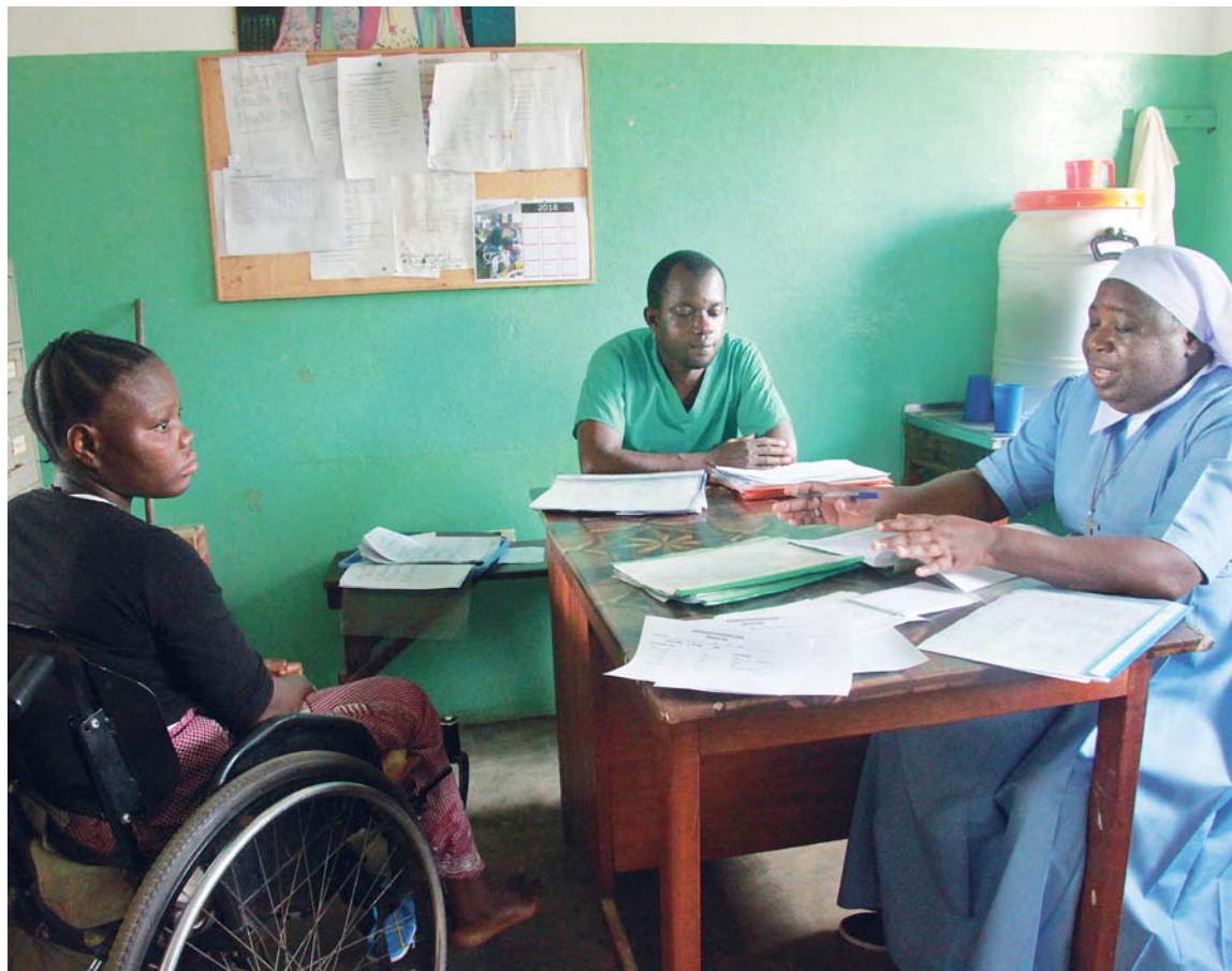
Práce lékaře se podobá práci detektiva: musí zmapovat, kdy pacient zpozoroval příznaky nemoci a kde se mohl nakazit.

Byla jsem zvyklá sledovat zprávy v televizi, ale tady to je kvůli slabému signálu a nestabilní elektřině velmi obtížné. Také možnosti kultury je tu mnohem méně než v Tanzanii. V hlavním městě by to bylo asi o něco lepší, ale tady jsme až u hranic.