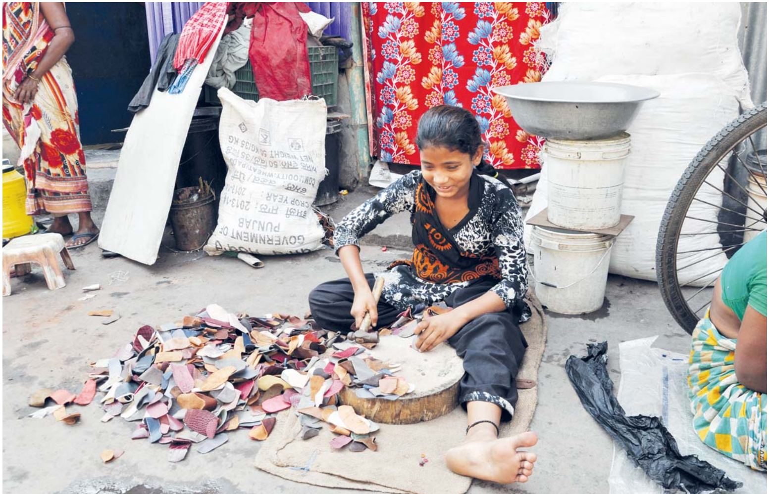
I ti, kteří žijí v naprosté chudobě, se pokoušejí dát svému životu smysl a být užiteční. Dívka v kalkatském slumu zpracovává kůži pro další výrobky.

„Cesta křesťanů ať je cestou prožívané solidarity s nejmenšími. Nouze druhých ať křesťané vnímají jako své vlastní.“ Takovým způsobem vnímal solidaritu svatý papež Jan XXIII. Důvodem mu bylo milosrdenství Boží, které vybízí člověka k pozornosti k chudým, slabým a ukřivděným. Sám Ježíš šel touto cestou solidarity, milosrdenství a pokoje.