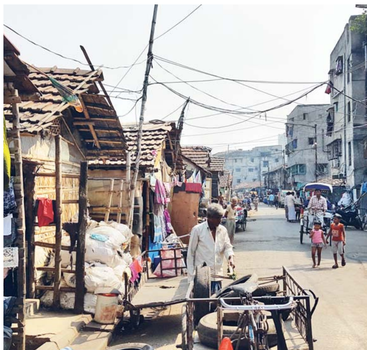
Život na ulici v Kalkatě.

Vaše dary mohou pomoci i vám! Rádi vám na každý dar vystavíme darovací smlouvu nebo potvrzení o daru, ten si tak můžete odečíst ze základu daně.